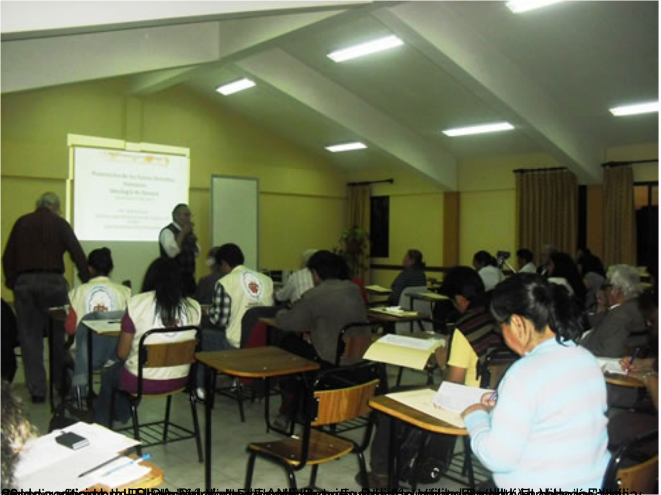
20 de septiembre de 2013. Club de Fútbol de San Andrés Bata, municipio de San Andrés Bata, Estado Lara, Venezuela.